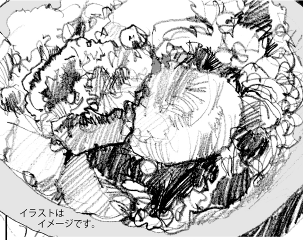
イラストはイメージです。